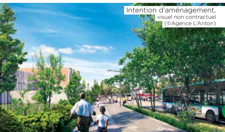
Intention d'aménagement, visuel non contractuel

Mesdames, Messieurs, Le Département souhaite faciliter l'accès de tous à la future ligne 15 du métro qui desservira le secteur de Bry-Villiers-Champigny. Pour cela, le Département étudie la réalisation d'une voirie entre la future gare du métro et la route départementale 4 à Chennevières-sur-Marne. Cette première étape du projet baptisé Altival offrira une liaison nouvelle pour les cyclistes, les piétons, les automobilistes mais aussi pour les bus du secteur. Grâce à une voie réservée aux bus, Altival permettra d'accéder rapidement au métro depuis les quartiers alentour, dont ceux des Mordacs et du Bois-l'Abbé. Ce projet permettra également la reconversion des emprises de l'ancien projet autoroutier de l'État, emprises dites de l'ex-voie de desserte orientale. En lieu et place de cette friche à l'abandon, Altival prendra sa place et accompagnera l'implantation d'entreprises et d'emplois prioritairement. L'enquête publique d'Altival vous permettra de vous exprimer sur cette nouvelle voirie. Je vous invite à donner votre avis sur ce projet majeur pour l'est du Val-de-Marne.